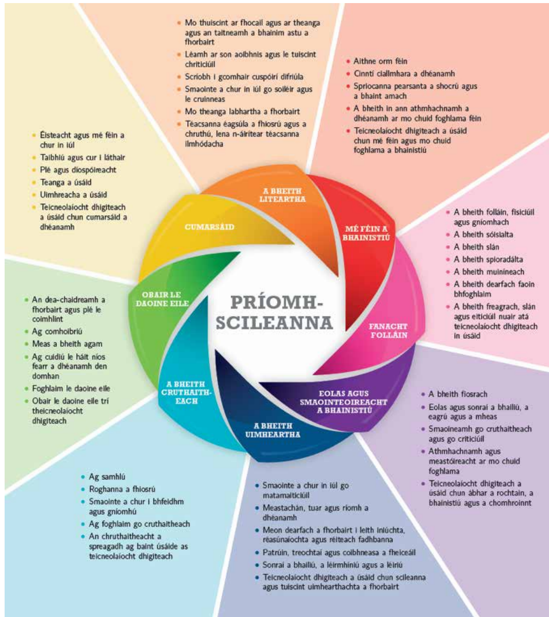
Fíor 1: Príomhscileanna na sraithe sóisearaí

Cuireann an cúrsa seo deiseanna ar fáil chun tacú leis na príomhscileanna uile, ach tá roinnt díobh a bhfuil tábhacht ar leith leo. Sainaithníonn na samplaí thíos cuid de na gnéithe atá bainteach le gníomhaíochtaí foghlama san fhealsúnacht. Chomh maith leis sin, is féidir leis an múinteoir a lán de na gnéithe eile de phríomhscileanna ar leith a fhí isteach ina chuid pleanála don seomra ranga.