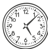
Léiritheach = Líniocht de chlog