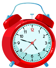
Coincréiteach = Úsáid fíorchlog