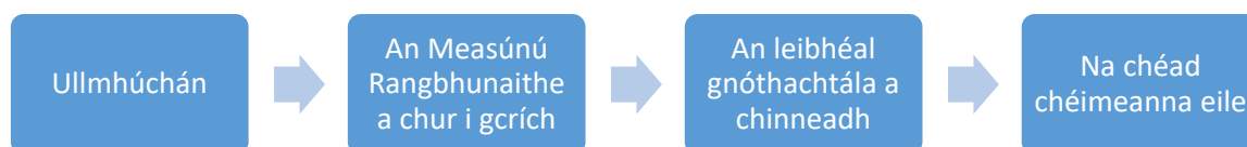
Fíor 1. An próiseas a bhaineann le Measúnú Rangbhunaithe 1 a dhéanamh

Leagtar amach i bhFíor 1 thíos an próiseas a bhaineann le Measúnú Rangbhunaithe 1 a dhéanamh. Is é aidhm an phróisis seo treoir a thabhairt don mhúinteoir de réir mar a thacaíonn sé lena scoláire Measúnú Rangbhunaithe 1 a chur i gcrích.