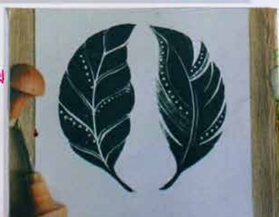
Fawnfaye (Faye Laura) - Etsy.com

There are a lot of detailed cuts including small lines and circles.