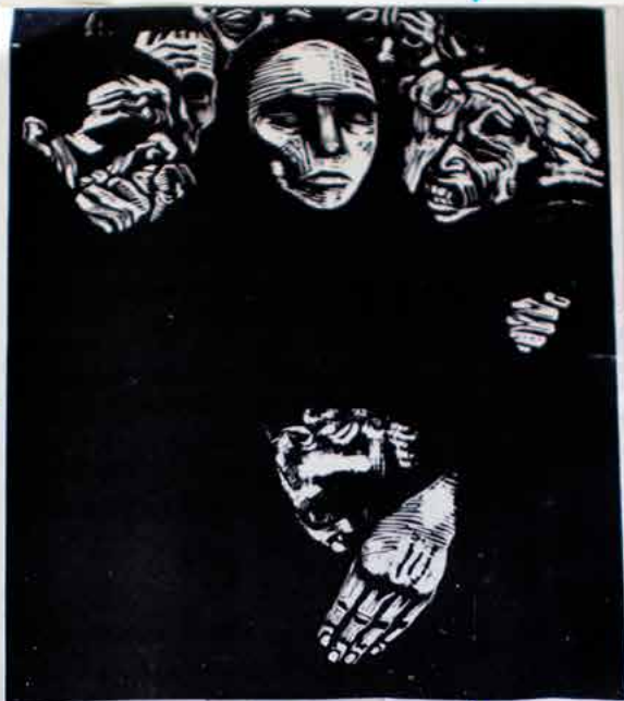
Käthe Kollwitz, The People, 1923

Texture in all the faces you can see all the wrinkles in the faces.