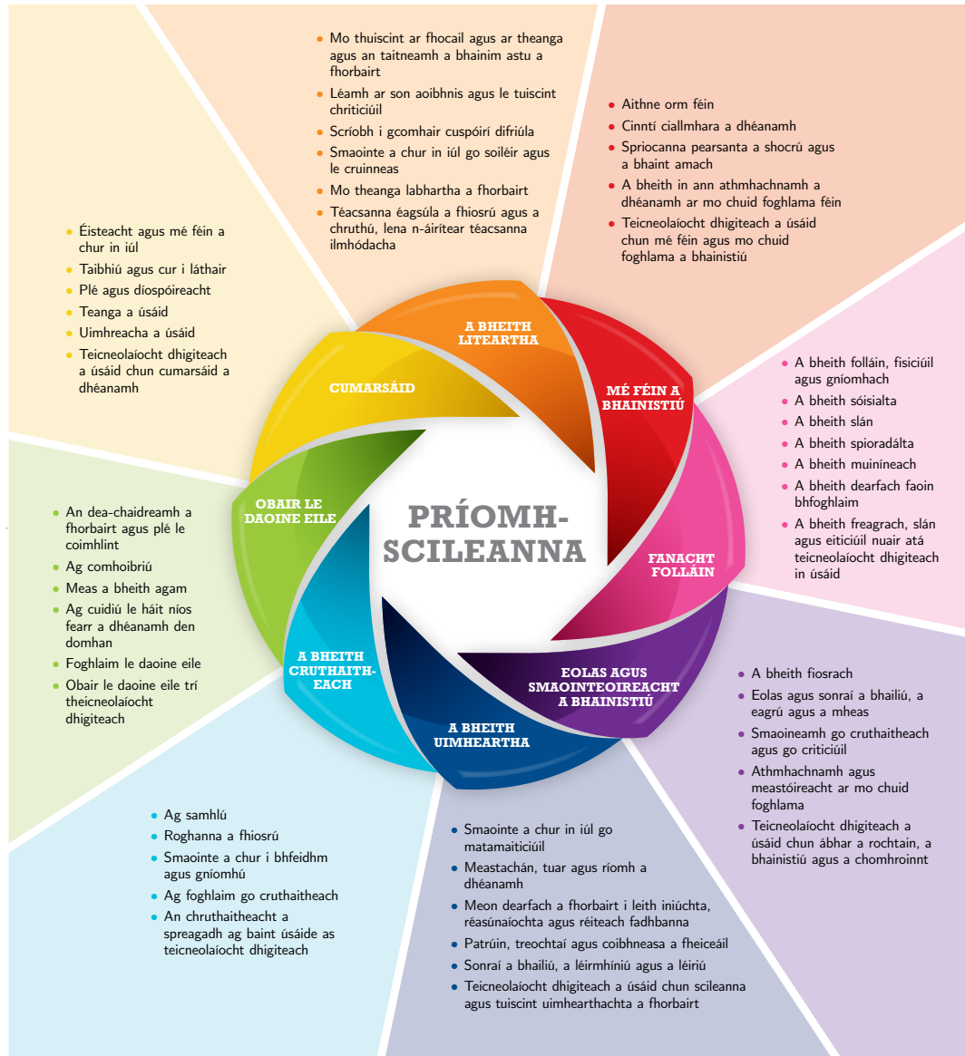
Fíor 1: Príomhscileanna na Sraithe Sóisearaí