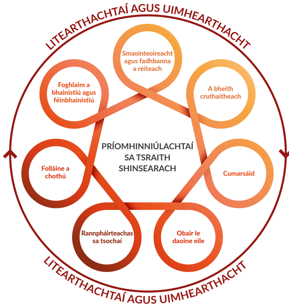
Fíor 2: Príomhinniúlachtaí sa tSraith Shinsearach, lena dtacaíonn litearthachtaí agus uimhearthacht

Tá na hinniúlachtaí seo idirnasctha agus is féidir iad a thabhairt le chéile; tá siad in ann foghlaim iomlán an scoláire a fheabhsú; in ann cabhrú leis an scoláire agus leis an múinteoir naisc bhríocha a dhéanamh idir agus thar réimsí foghlama difriúla; agus tá tábhacht ag baint leo ar fud an churaclaim.