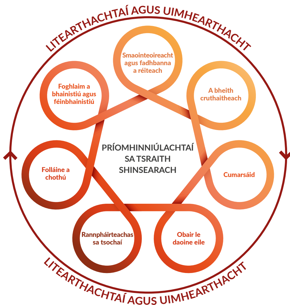
Fíor 1: Príomhinniúlachtaí sa tSraith Shinsearach a dtacaíonn litearthachtaí

Tá tuilleadh faisnéise faoi príomhinniúlachtaí na sraithe sinsearaí ar ncca.ie .