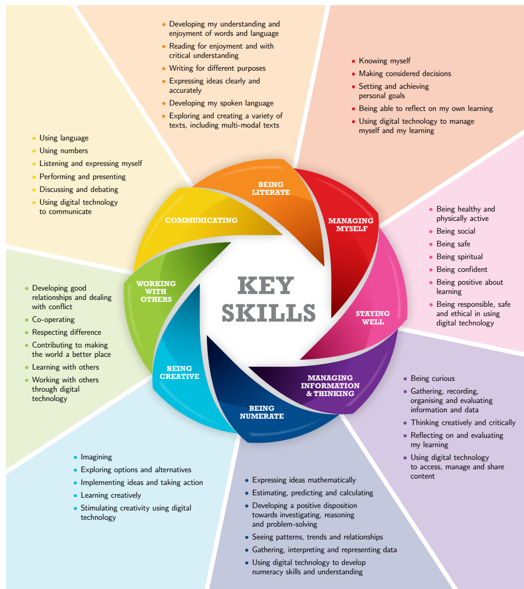
Fíor 1: Príomhscileanna na sraithe sóisearaí

Díríonn curaclam na sraithe sóisearaí ar ocht bpríomhscil: