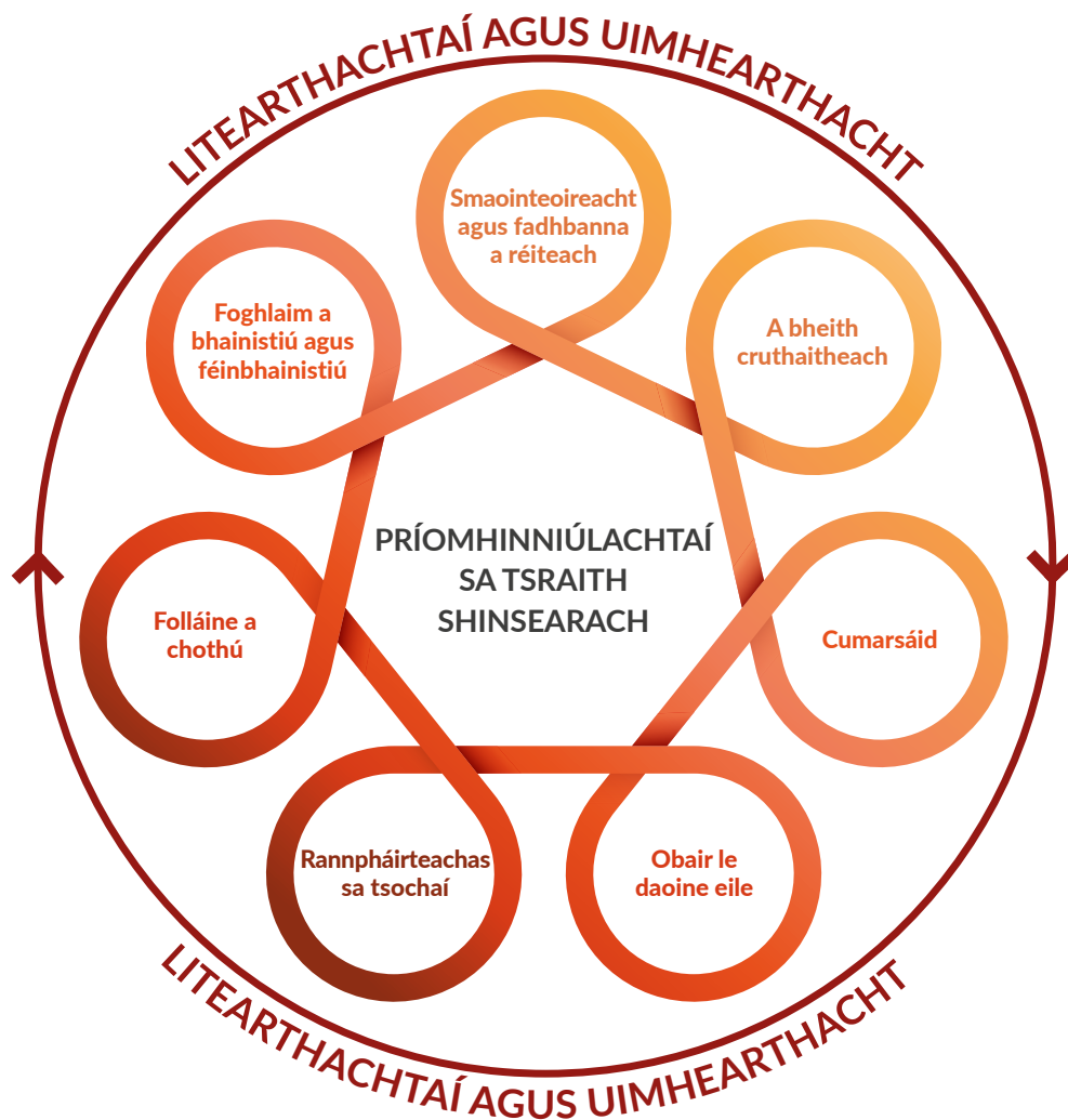
Fíor 2: Príomhinniúlachtaí sa tSraith Shinsearach, lena dtacaíonn litearthachtaí agus uimhearthacht

Tá na hinniúlachtaí seo idirnasctha agus is féidir iad a thabhairt le chéile; tá siad in ann foghlaim iomlán na scoláirí a fheabhsú; tá siad in ann cabhrú leis na scoláirí agus leis na múinteoirí naisc bhríocha a dhéanamh idir agus thar réimsí foghlama difriúla; agus tá tábhacht ag baint leo ar fud an churaclaim.