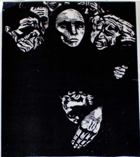
Käthe Kollwitz, The People, 1923.

Texture in all the faces, you can see all the wrinkles in the faces.