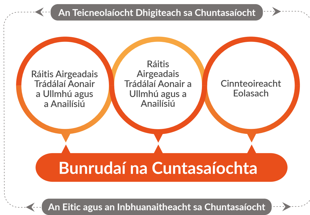
Fíor 3: Léargas ar an tsonraíocht

learning and should be the starting point for each new area of learning. The strand is designed to be woven throughout the two years of senior cycle as appropriate and the learning set out for students in this strand links with the learning in the other three strands.